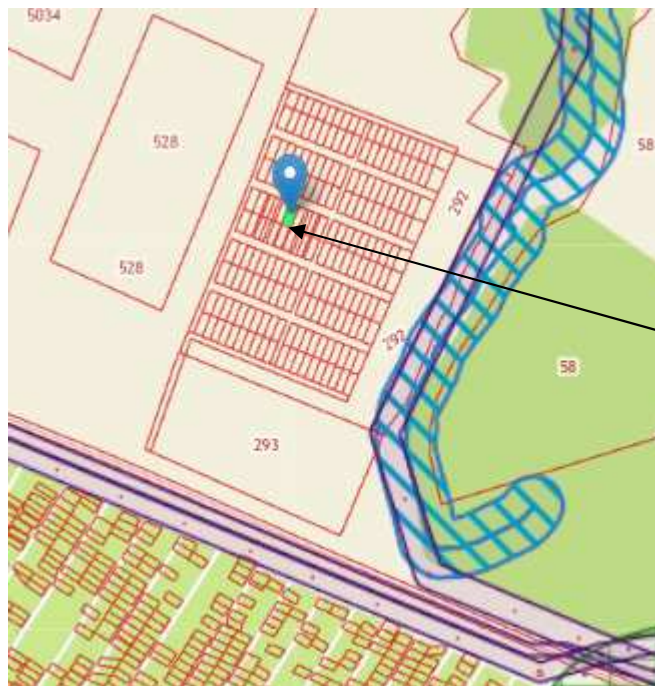
Рис.3. Выкопировка из публично – кадастровой карты земельных участков города Воткинска

Земельный участок с кадастровым номером 18:27:070002:523