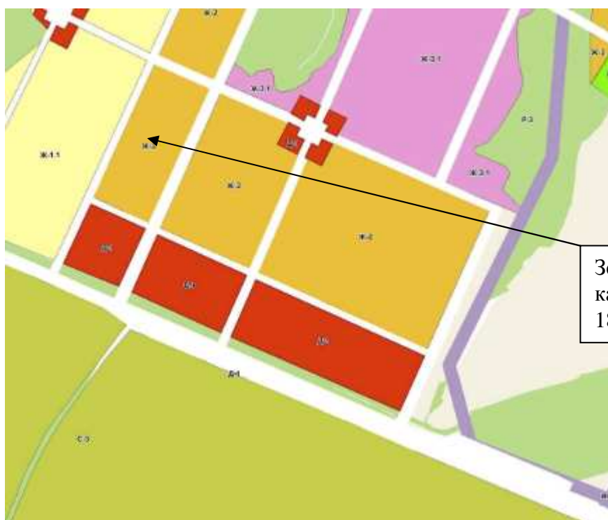
Рис.2. Выкопировка из ПЗЗ г.Воткинска.

Земельный участок с кадастровым номером 18:27:070002:523